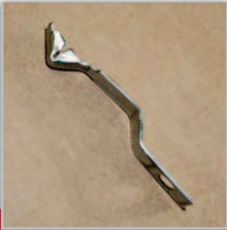
MOLLA AGGANCIA RULLO CLIPS SPRING ЗАЖИМ ПРУЖИНЫ РОЛИКА