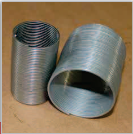
MOLLA PER RULLO SPRING FOR ROLL ПРУЖИНА ДЛЯ РОЛИКА