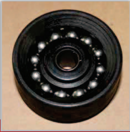
CUSCINETTO BEARING ПОДШИПНИК