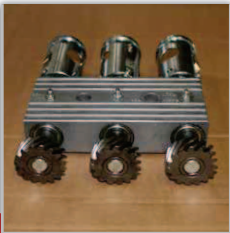
GRUPPO PORTARULLI ROLLER SUPPORTING СУППОРТ РОЛИКА