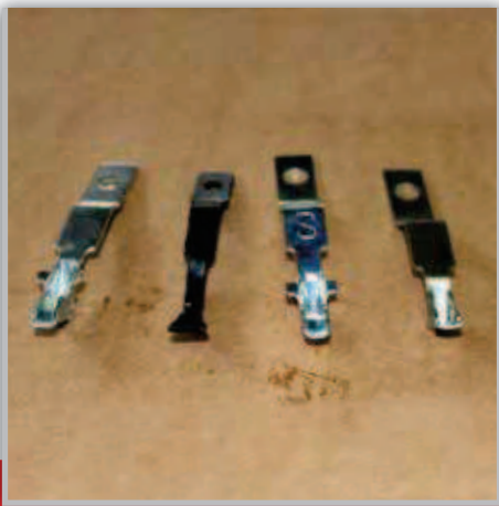
MOLLA AGGANCIA RULLO CLIPS SPRING ЗАЖИМ ПРУЖИНЫ РОЛИКА