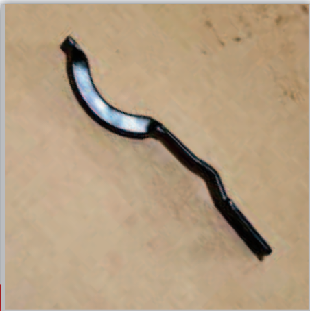
MOLLA AGGANCIAMENTO RULLO CLIPS SPRING ЗАЖИМ ПРУЖИНЫ РОЛИКА