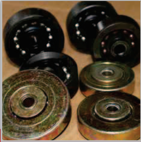
CUSCINETTO BEARING ПОДШИПНИК