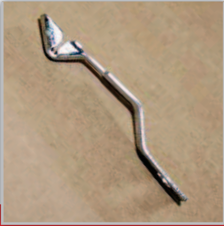
MOLLA AGGANCIA RULLO CLIPS SPRING ЗАЖИМ ПРУЖИНЫ РОЛИКА